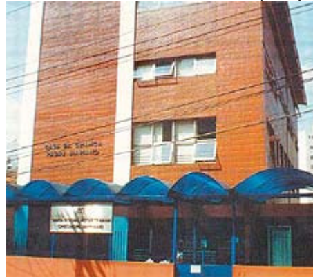
Fachada do prédio que sedia o 'complexo Pe. Mariano', em São Paulo

Na primeira missa em louvor ao beato Padre Mariano, em 6 de novembro, segunda-feira, às 9 horas, na paróquia Santo Agostinho (SP), um coral de 30 crianças promete emocionar o público, cantando a versão musicada de uma das mais lindas orações do cristianismo, "Tarde te amei", criada por Santo Agostinho. Estas são algumas das 380 crianças assistidas pela creche da Obra Social Padre Mariano, entidade criada a partir de uma idéia do beato. Padre Mariano era um homem preocupado com o ser humano, dizem seus contemporâneos. Com freqüência no inverno, descia dos aposentos agostinianos para agasalhar com cobertores os mendigos da praça em frente à igreja. Depois do almoço, descia até as obras do metrô Vergueiro para conversar com os operários e, de quebra, evangelizar. Encaminhava sanduíches ao porteiro para que distribuisse aos pedintes da área, não queria ver ninguém com fome. E de tanto subir e descer a rua Apeninos para levar comunhão e conforto aos doentes do Hospital do Câncer, do Servidor Público e do Municipal, padre Mariano viu que não bastava sair com o bolso cheio de balas e afagar a cabeça das crianças pobres que por ali perambulavam.