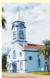
Chegada: Igreja São Luiz Gonzaga em Cedral