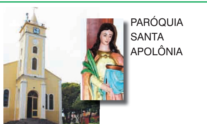
PARÓQUIA SANTA APOLÔNIA

COLÉGIO – Dirigido pelos padres agostinianos (Ordem de Santo Agostinho), o Colégio São José instalou-se em 28 de agosto de 1947 no distrito de Engenheiro Schmidt (era internato). Transferiu-se para o prédio atual a 19 de março de 1971.