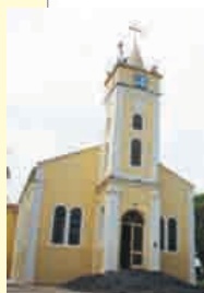
Partida: Igreja Santa Apolônia em Engenheiro Schmitt